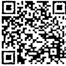
แบบตอบรับออนไลน์

แบบตอบรับ ประชุมแนวทางการพัฒนาคุณภาพชีวิตและการดูแลสุขภาพของประชาชนในพื้นที่ โดยกองทุนหลักประกันสุขภาพในระดับท้องถิ่นหรือพื้นที่ (กองทุนตำบล) วันที่ ๒๐ กรกฎาคม ๒๕๖๐ เวลา ๐๘.๓๐ - ๑๖.๐๐ น. ณ โรงแรมเซ็นทรา ศูนย์ราชการ ถนนแจ้งวัฒนะ เขตหลักสี่ กรุงเทพฯ