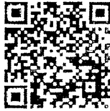
แบบตอบรับออนไลน์